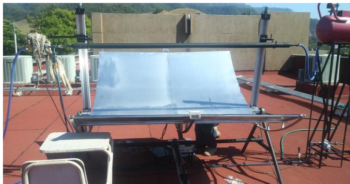
Figura 3. Etapa de pruebas del refrigerador solar