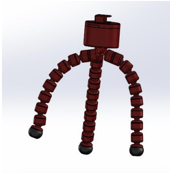
Figura 2. Trip Cam 360°, versión 1

A continuación, se muestran imágenes de los prototipos desarrollados hasta el momento en el proyecto del semillero de investigación.