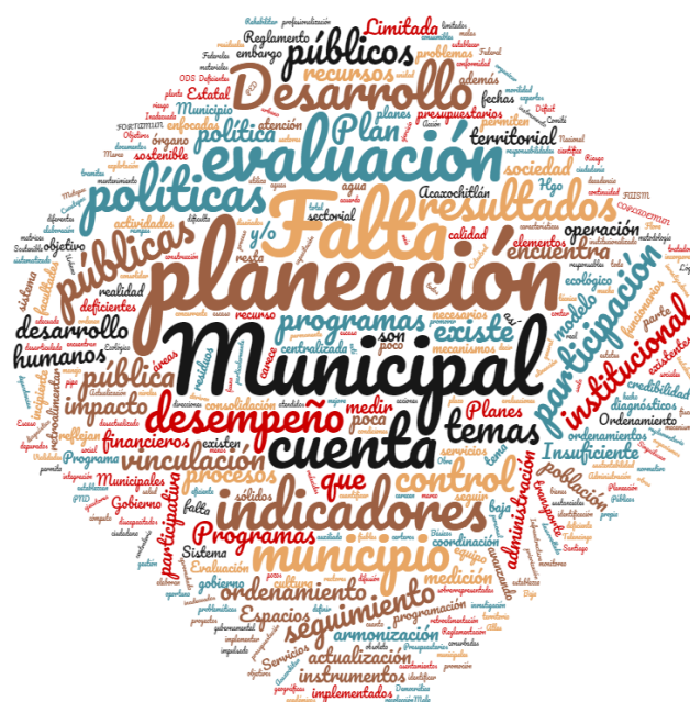
Figura 5. Nube de palabras de los principales factores que impactan a la política de Planeación y Evaluación

Nota: Elaboración propia basada en los Planes Municipales de Desarrollo 2020 – 2024 de los siete municipios del VT.