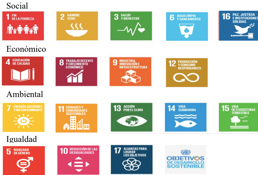
Figura 2. Objetivos de Desarrollo Sostenible al 2030 por tipo de Desarrollo

Nota: Elaboración propia, adaptado de Echave (2020) Vínculo de las atribuciones municipales sustantivas a las 17 ODS. [Tabla 1a. y 1b.] Gob. Mex. México.