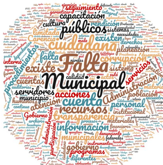
Figura 3. Nube de palabras de los principales factores que impactan a la política de Gobernanza y Rendición de Cuentas

Nota: Elaboración propia basada en los Planes Municipales de Desarrollo 2020 – 2024 de los siete municipios del VT.