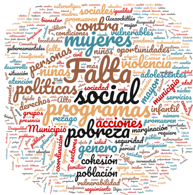
Figura 4. Nube de palabras de los principales factores que impactan a la política Social

Nota: Elaboración propia basada en los Planes Municipales de Desarrollo 2020 – 2024 de los siete municipios del VT.