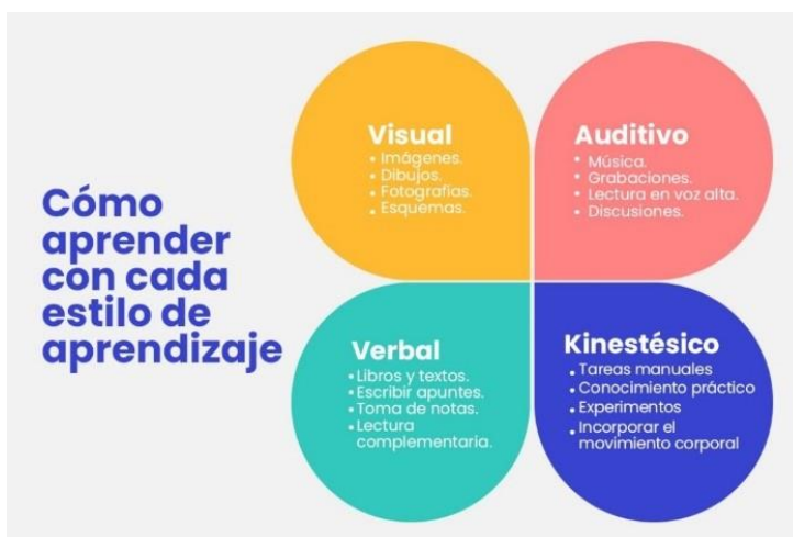
Figura 2. Cómo aprender con cada estilo de aprendizaje