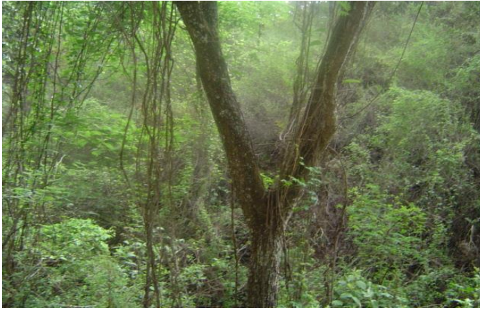
Fotografía 4. Selva baja caducifolia.