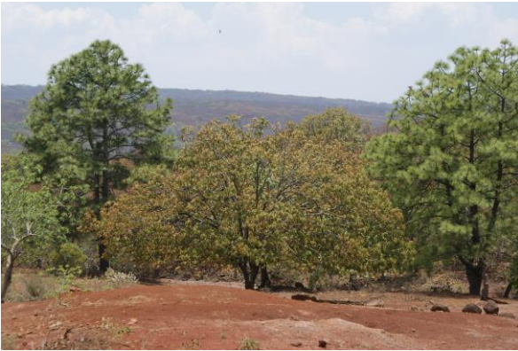
Fotografía 2. Bosque encino-pino.