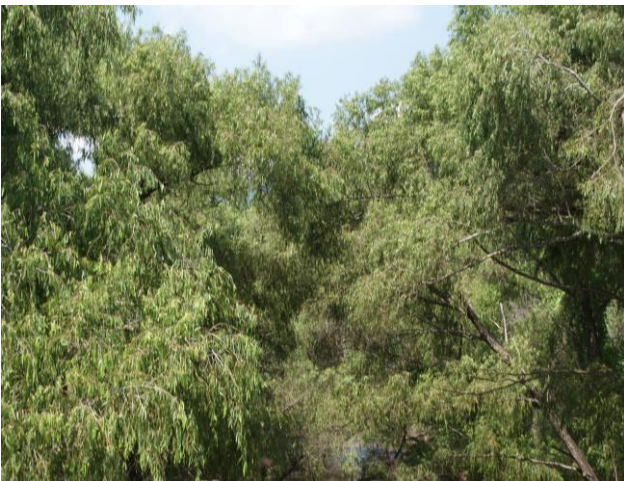
Fotografía 3. Bosque de galería.