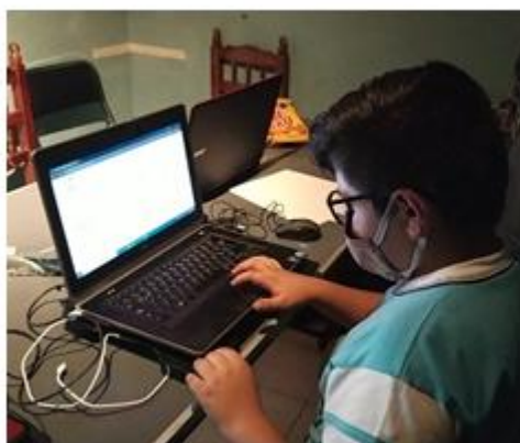
Figura 4. Usuarios interactuando con el sistema

2. Instrucción general. Se dieron las instrucciones, paso a paso, sobre el uso del sistema; además, se resolvieron dudas y los participantes interactuaron con las actividades, tal como se puede observar en la figura 4.