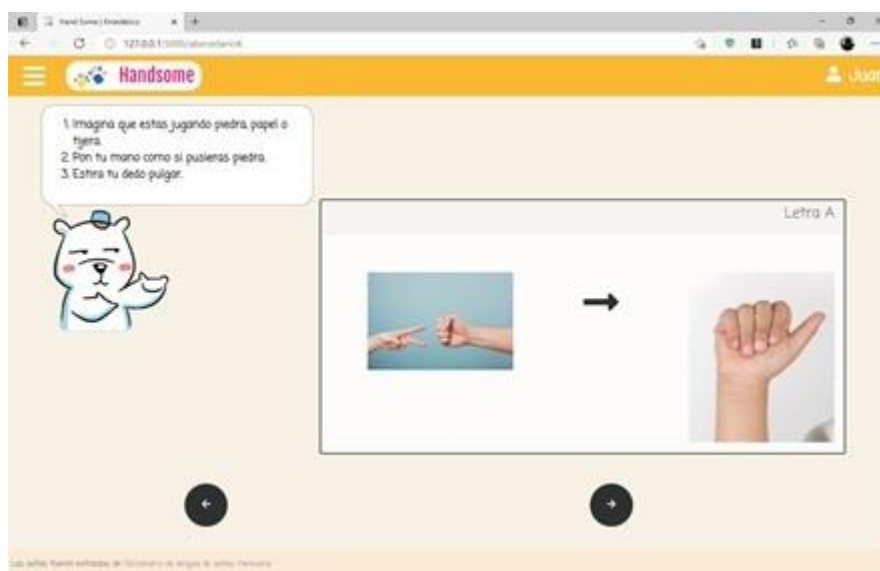
Figura 3. Instrucción de las letras en el estilo de aprendizaje kinestésico

Una vez identificado el estilo de aprendizaje, se inicia la instrucción de las señas del abecedario y los números. Para el estilo de aprendizaje visual, se le proporcionan las instrucciones al niño para realizar la seña, además de una imagen de esta. Para el estilo de aprendizaje auditivo, se usan audios que pronuncian las reglas para realizar la seña en cuestión. Finalmente, para la instrucción kinestésica se emplean analogías para que el usuario pueda, partiendo de alguna seña o gesto que haya utilizado o visto previamente, llegar a aquella que se le está mostrando. La figura 3 enseña este tipo de instrucción para las letras.