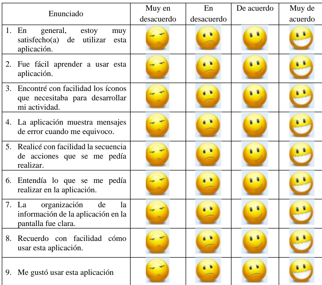
Tabla 1. Encuesta aplicada al usuario

Esta encuesta se realizó para evaluar la interacción con el sistema. Las respuestas obtenidas permitieron identificar aquellos aspectos que se pueden mejorar. Para la aplicación, se les solicitó a los alumnos leer detenidamente cada uno de los enunciados y que marcaran con una “x” la opción que mejor representara su nivel de acuerdo/desacuerdo con él. En caso de dudas, podían preguntar al instructor encargado. El enunciado de la pregunta se encuentra en la primera columna y las opciones de respuesta en las cuatro siguientes (tabla 1).