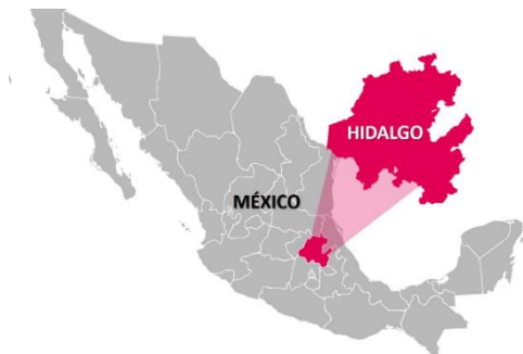
Figura 2. Ubicación geográfica del área de estudio

el sector comercial en comparación con el de servicios e industrial, similar a lo que ocurre en la mayoría de los países en vías de desarrollo (López, 2007).