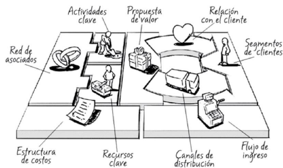
Figura 1. Business model canvas