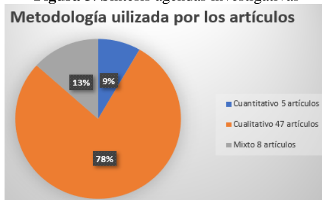
Figura 3. Síntesis agendas investigativas