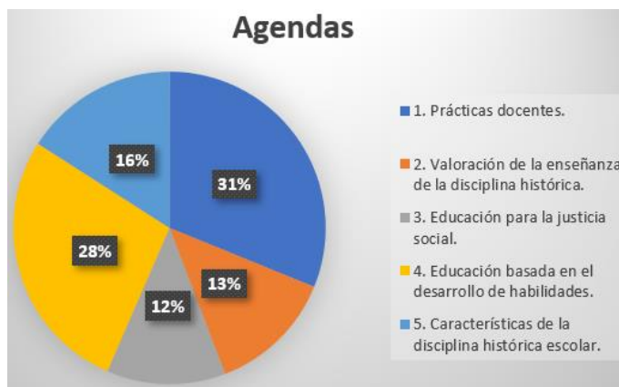
Figura 1. Síntesis agendas investigativas

Sobre "Valoración de la enseñanza de la disciplina histórica", correspondiente a 13 % del total (ver figura 1), tiene un porcentaje equilibrado en BERJ y JTE con 19 % y 14 % respectivamente (ver figura 2), distinta situación en Estped y NZJES, con 9 % y 8 % respectivamente, lo que se explica por la amplitud temática de las revistas, sin embargo, en NZJES, si bien se manifiesta la valoración de la disciplina, esta corresponde solo a un artículo, lo que podría causar una desambiguación de la realidad cuando leemos los porcentajes, por tanto, se confirma lo expuesto en el párrafo anterior, que NZJES se enfoca en la publicación de temas más genéricos de la investigación educativa.