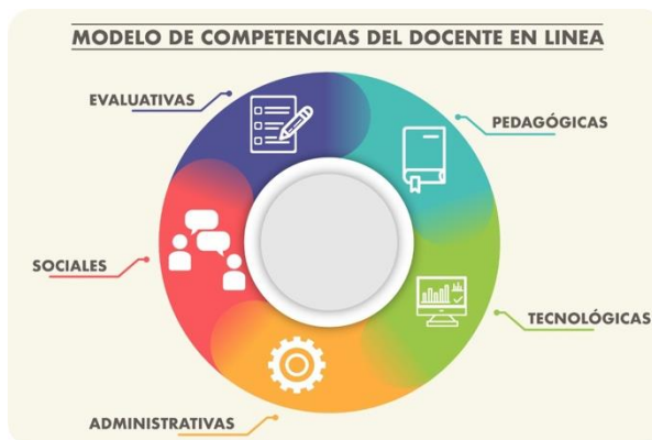
Figura 2. Modelo de competencias del docente en línea