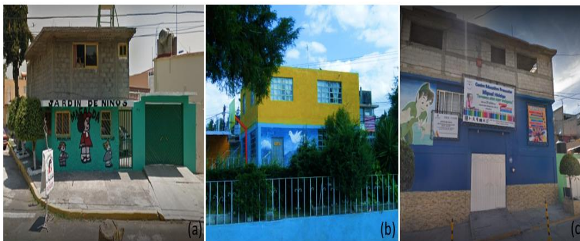
Figura 2. Evidencia de construcciones con diseño habitacional que funcionan como planteles educativos (jardín de niños)

(a) Estado de Tlaxcala de Xicoténcatl (2018), (b) Estado de Querétaro, municipio Arroyo Seco (2018) y (c) Ciudad de México, municipio Miguel Hidalgo (2018).