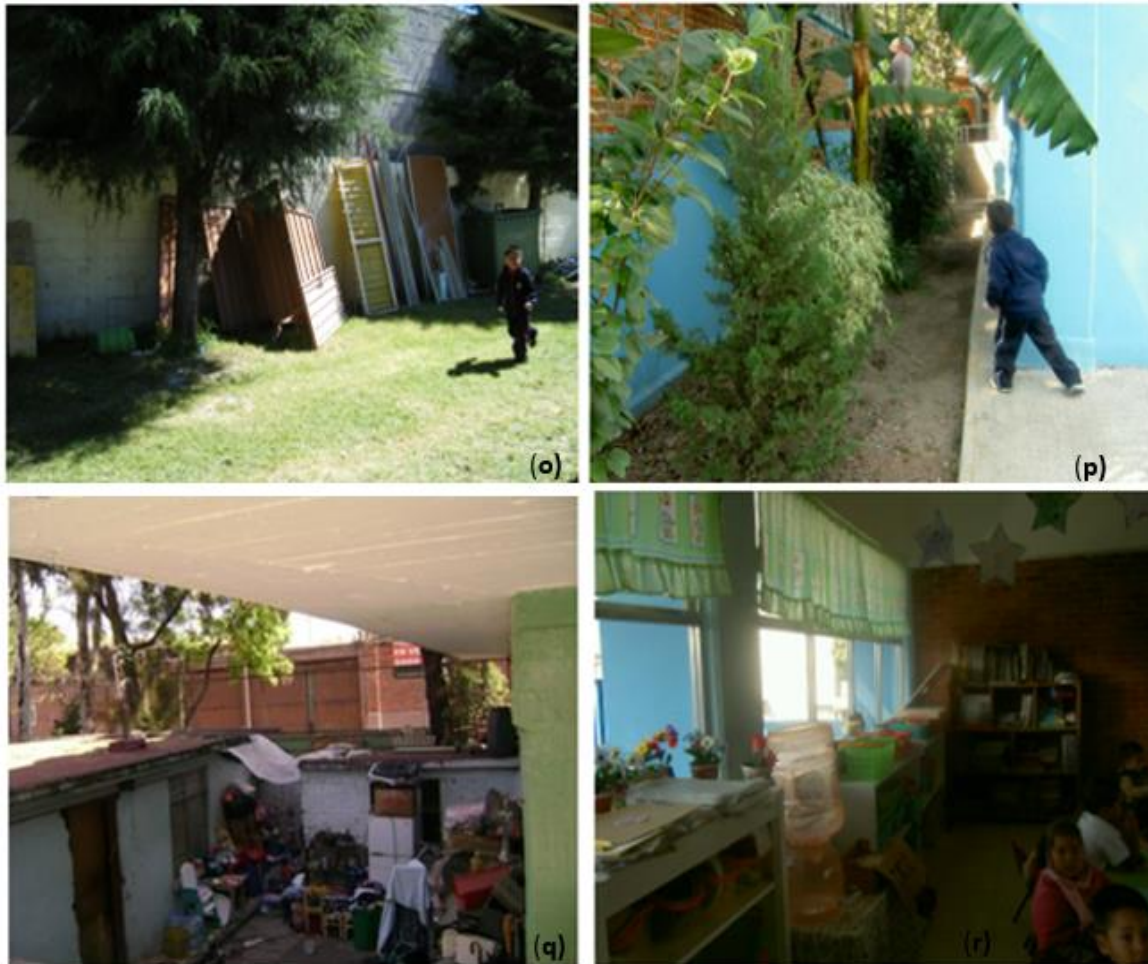
Figura 7. Áreas interiores de las casas adaptadas como planteles educativos que colindan con otras casas usadas como bodegas, cocinas, etc.

(o) Estado de México, municipio de Atizapán Zaragoza (2019), (p) Ciudad de México, municipio Azcapotzalco (2019), (q) Estado de Hidalgo, municipio de Lerma y (r) Estado de Querétaro, municipio de Huimilpan