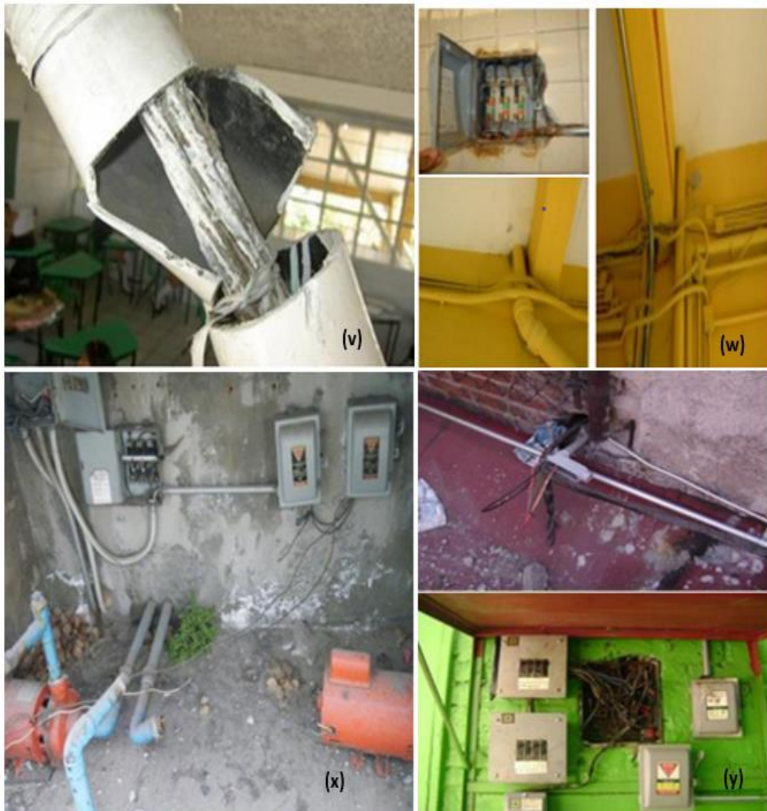
Figura 9. Nulo mantenimiento eléctrico en las instalaciones

(v) Estado de Querétaro, municipio de Huilmán (2019), (w) Ciudad de México, municipio Tláhuac (2019), (x) Estado de México, municipio de Acolman, (y) Estado de Tlaxcala municipio de Ixtenco