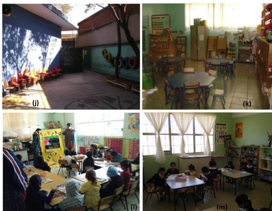
Figura 5. Áreas de casas adaptadas para funcionar como espacios educativos, carentes de cumplimiento normativo en iluminación, ventilación, mobiliario y áreas comunes para impartir clases a nivel de educación preescolar

(j) Estado de Querétaro, municipio de Tolimán (2018), (k) Estado de Morelos, municipio de Yautepec (2019), (l) Estado de Tlaxcala, municipio Zacatelco (2019), (m) Estado de Hidalgo, Tolcayuca (2018).