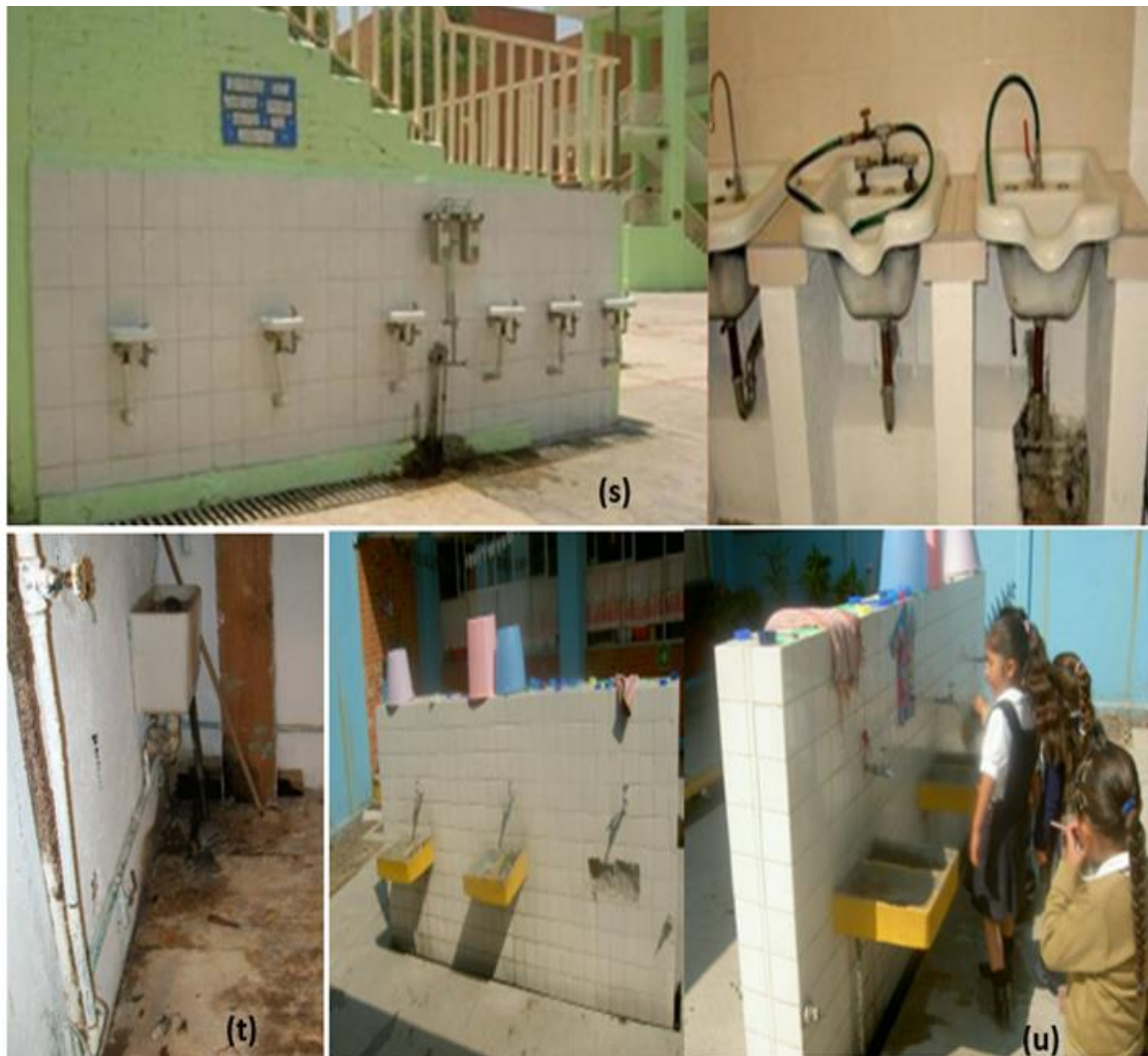
Figura 8. Instalaciones hidrosanitarias en mal estado y ambiente carente de higiene

(s) Estado de Querétaro, municipio de Tolimán (2019), (t) Ciudad de México, municipio Azcapotzalco (2019), (u) Estado de México, municipio de Coacalco de Berriozábal