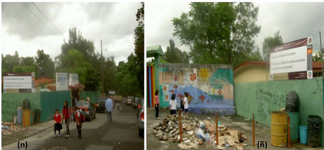
Figura 6. Planteles educativos que colindan en sus espacios exteriores con vías primarias sin protección ni señalización alguna (para los menores que transitan diariamente), así como con basureros a cielo abierto perjudiciales para la salud (transmisión de enfermedades infecciosas)

(n) Estado de Tlaxcala, municipio de Apizaco (2019), (ñ) Estado de Hidalgo, municipio de Chilcuautla (2019)