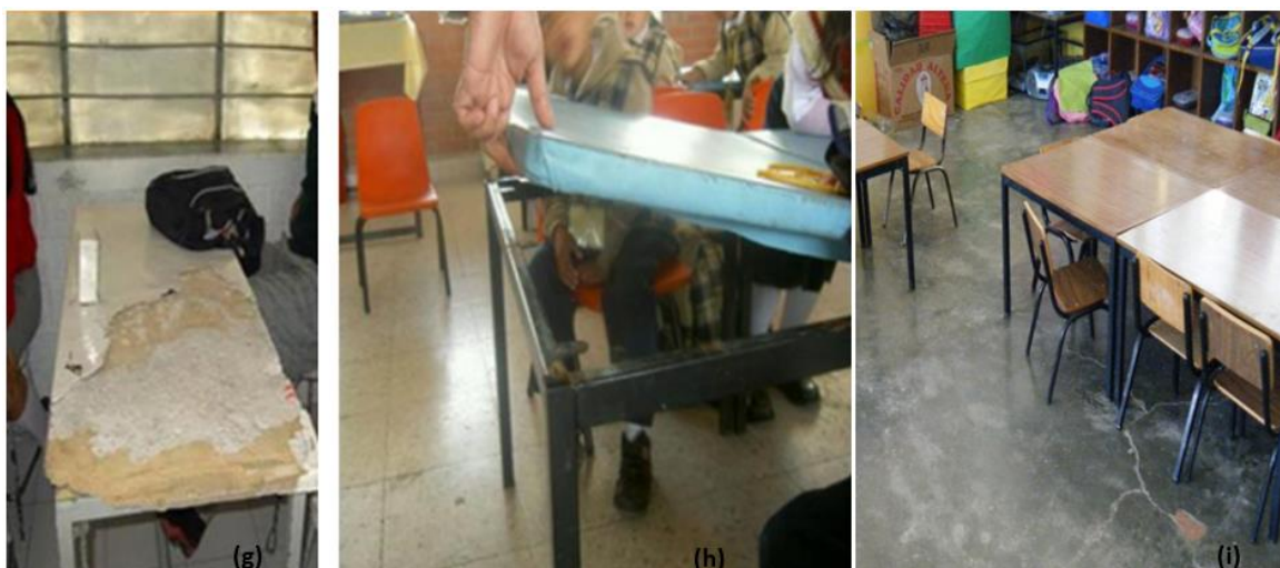
Figura 4. Mobiliario fuera de la norma para el nivel escolar, con material frágil, nulo mantenimiento y cantidad de mobiliario inadecuado

(g) Estado de Hidalgo, municipio de Atapexco (2019), (h) Ciudad de México, municipio de Xochimilco (2019), (i) Estado de México, municipio de Ecatepec (2019)