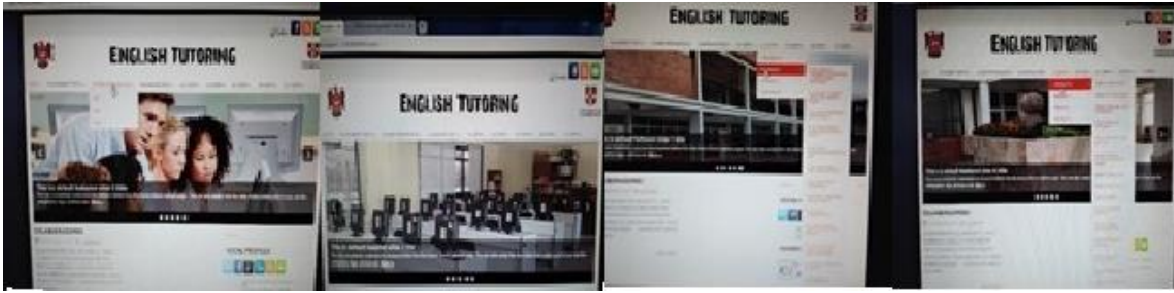
Figura 5. Imágenes de pantalla de la suite interna de autoría propia, en Wordpress