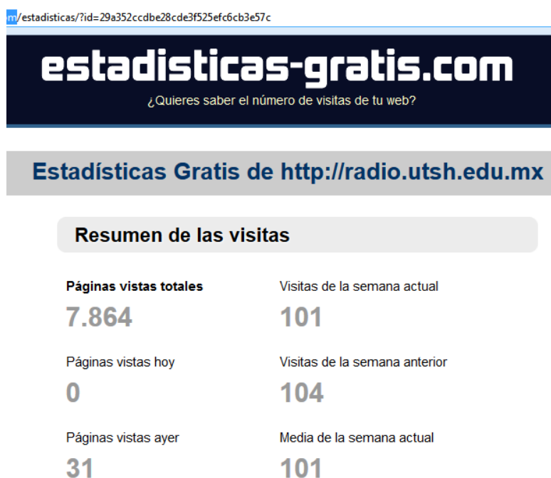
Figura 2. Imagen de la página de estadísticas para el dominio de la radio.

Los usuarios potenciales para conectarse diariamente de manera simultánea son 31 alrededor del mundo (Ver Figura 2), comprendidos en 18 países (Ver Tabla 3). Para atender la demanda actual y ofrecer un servicio de calidad de streaming (transmisión de programas radiofónicos) se requiere incrementar y contar con un ancho de banda de 4Mbps (2 Mbps de subida y 2 Mbps de bajada de datos si fuera simétrica).