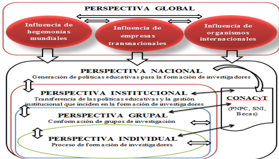
Figura 1. Modelo para el análisis de las interrelaciones existentes en la formación de investigadores