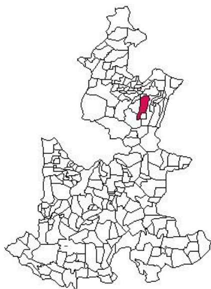
Figura 1. Localización del municipio de Zacapoaxtla, Puebla

La cascada La Gloria está localizada a 15 minutos de la carretera Zacapoaxtla-Cuetzalan. Sus coordenadas son 19°54'14.08" al norte y 97°37'04.55" al oeste a 1520 m. sobre el nivel del mar. Pertenece al municipio de Zacapoaxtla localizado en la parte norte del estado de Puebla, colindando al Norte con Cuetzalan del Progreso y Nauzontla, al Este con Tlatlauquitepec y Zaragoza. Al Sur con Zautla, y al Oeste con Xochiapulco y Nauzontla (Figura 1).