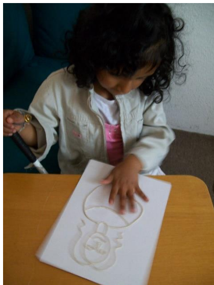
Niña (ciega adquirida) participante en las pruebas de los materiales