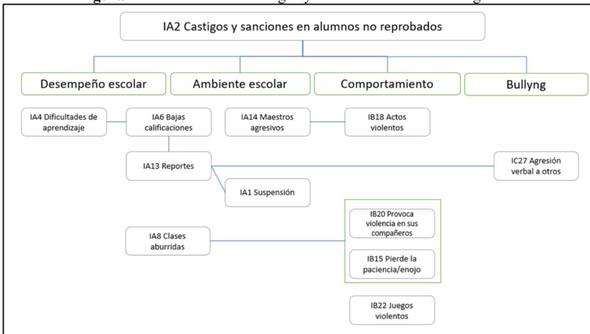
Figura 2. Relación de los castigos y sanciones en alumnos regulares

parte de los alumnos y esto, a su vez, se traduce en sanciones materializadas en suspensiones temporales.