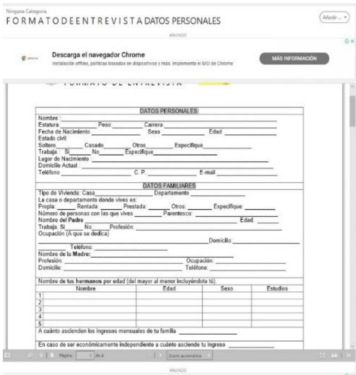
Figura 4. Diagnóstico inicial (tutorados)