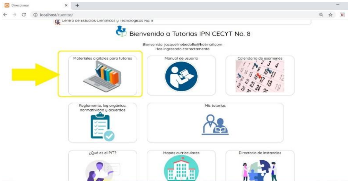
Figura 3. Materiales digitales para tutores