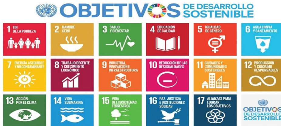
Figura 2. Objetivos de la Agenda 2030

problemas actuales que afectan sus comunidades. Uno de los aspectos más trascendentales de este enfoque pedagógico es que los exámenes que promueven la memorización como única forma de acreditación han quedado en el pasado y se han incorporado herramientas valiosas como el estudio de caso, el aprendizaje basado en problemas o los retos.