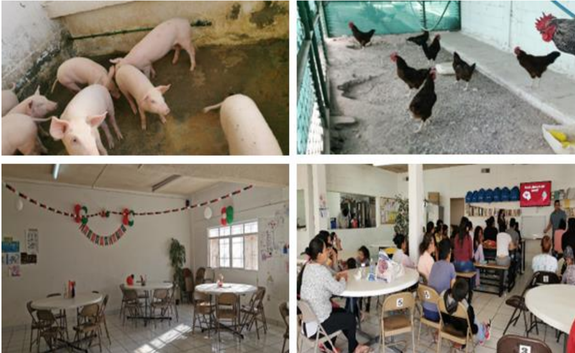
Figura 3. Albergue migrante San Matías en Ciudad Juárez

algún oficio que le permita un ingreso inmediato a través de la colaboración en las actividades productivas del albergue, ya que 49 % migra por cuestiones económicas y laborales.