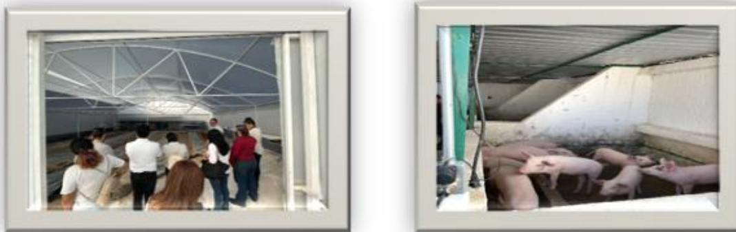
Figura 1. Fotografías del sembradío y la crianza de cerdos

Nadie salió de su país con la intención de estar en este albergue, tienen aspiraciones, un proyecto. Justo estos planes en los migrantes hacen difícil contar con recurso humano permanente para apoyar las actividades sostenibles del albergue.